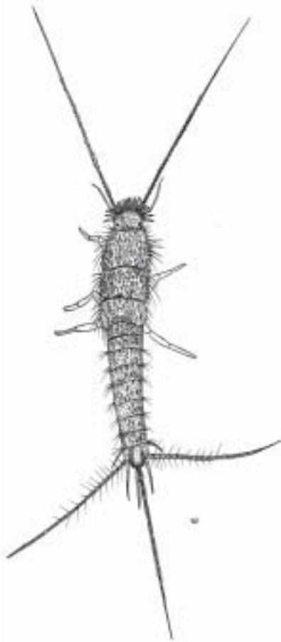
Figur 1. Ctenolepisma longicaudata Escherich, 1905. Illustration: Urban Wahlstedt

ma resultat men har oprecisa artbeskrivningar.